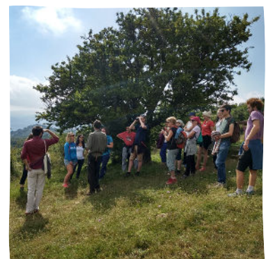
Accueil du public