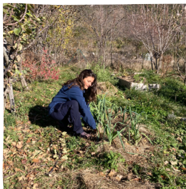
Entretien du jardin